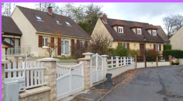
La forme courbe de la large voie, soulignée par l'implantation du bâti de maisons individuelles des Prés Jaumés