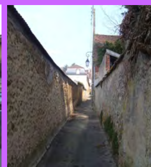
Une ruelle structurée par des murs de clôture élevés en pierre