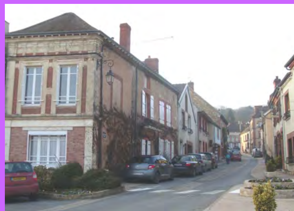
La trame viaire sinueuse, reliant les trois places principales du village, est structurée par l'alignement et la continuité du cadre urbain sur la voie.