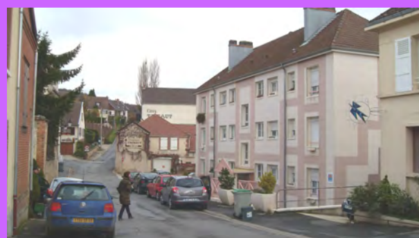
Une implantation en rupture du tissu d'un immeuble « plot » de 3 niveaux au cœur d'une parcelle, située en angle de rue