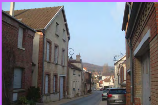
Deux arbres de grande hauteur, situés en limite du village, singularisent la perspective de la rue vers la forêt.