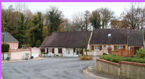
La forme ample de la voie de desserte des Prés Jaumés, qui se finalise par une boucle, marquée par l'élévation d'un arbre