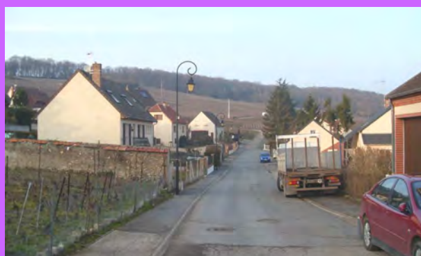
L'implantation en retrait des constructions éparses du tissu diffus sur la voie déstructurée