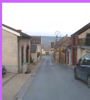
Une vue cadrée sur le paysage