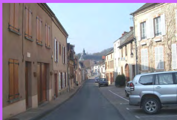
La trame parcellaire, de largeur limitée, génère une diversité du cadre urbain avec une continuité de l'alignement du bâti sur voie.

Ces ruelles sinueuses, structurées par le bâti et les hauts murs de clôtures, ouvrent des percées très cadrées vers le paysage. Ces espaces offrent des qualités urbaines singulières et rythment les parcours des piétons en alternant les dilatations et les resserments des voies par le bâti. Les ruelles desservent des vergers, des appentis, des constructions annexes, des vergers et des habitations en constituant ainsi un deuxième accès sur les parcelles en longueur.