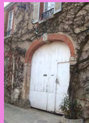
Différents types de portes cochères, donnant accès à une cour intérieure