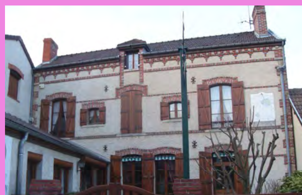
La disposition des ornements, la corniche en briques, la variété des percements génèrent une grande richesse architecturale.