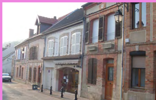
Façades, structurées par un rythme soutenu de travées, composées de percements avec des encadrements de briques très variés