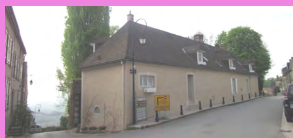
Longue façade sur rue peu ouverte, composée de quelques ouvertures variées et de dimensions réduites