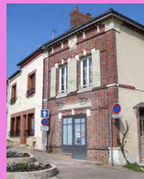
Composition variée de façades et de murs pignons