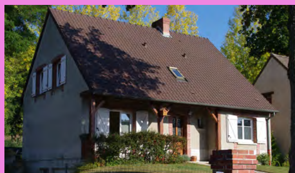
Percements encadrés de brique d'un pavillon récent au sein du tissu récent, inspirés des composantes locales de Hautvillers