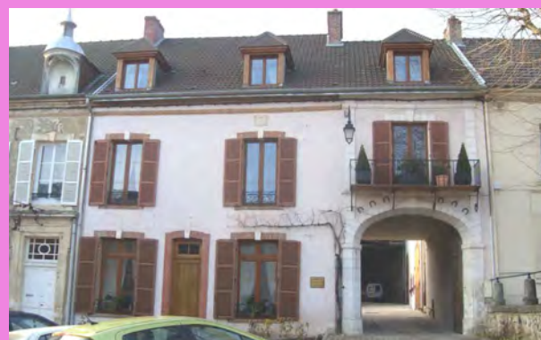
Plusieurs types de percements_ porte d'entrée, porte cochère, fenêtres_ sont organisés à partir de trois travées avec une légère asymétrie, créée par le positionnement de la porte.

La porte cochère constitue l'une des grandes caractéristiques des façades de Hautvillers : Elle se compose d'un portique, caractérisé par un encadrement en pierre, formé par un arc en anse de panier. Lorsque cette baie de grande dimension réalise une percée dans un bâtiment, elle devient alors chartil: Elle constitue un accès aux véhicules à la cour intérieure, encadrée de différents corps de bâti.