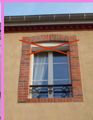
Intégration d'un volet roulant, positionné à l'extérieur de la baie, qui occulte une partie de la lumière