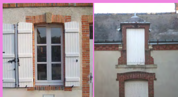
Volets bois à planches, peintes en blanc, soutenues par 3 traverses / volets à persiennes métalliques