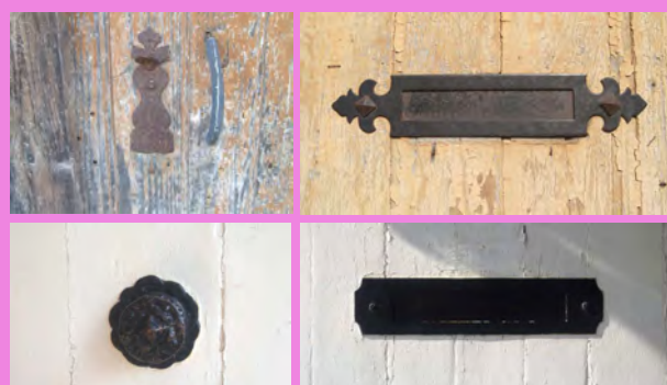
Divers éléments anciens de serrurerie et de ferronnerie à préserver, ornant les portes bois peintes