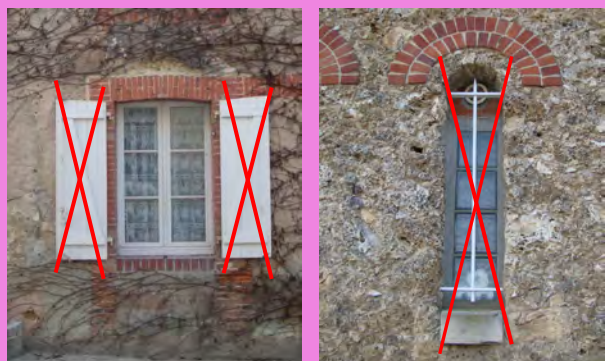
Menuiseries PVC épaisses et volets en écharpe sans dialogue avec l'architecture ancienne de la façade