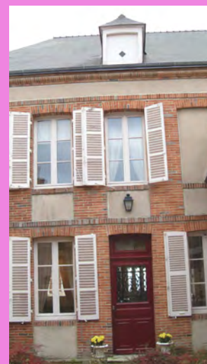
Des menuiseries bois diversifiées de couleur blanche, associées à des volets bois blancs à persiennes et à des portes à panneaux moulurés