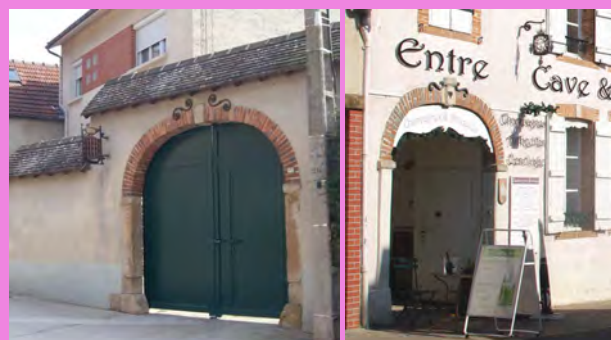
Porte cochère en menuiserie bois de couleur vert noir, soulignée par un encadrement de pierre, de brique et des ornements en fonte