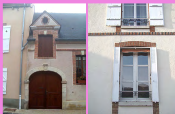
Volets bois peints à persiennes en brun, et porte cochère pleine en lames de bois verticales de même ton