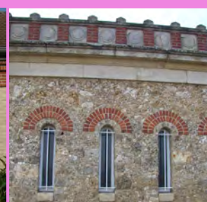
Baie divisée en deux parties par un meneau, revêtu de briques