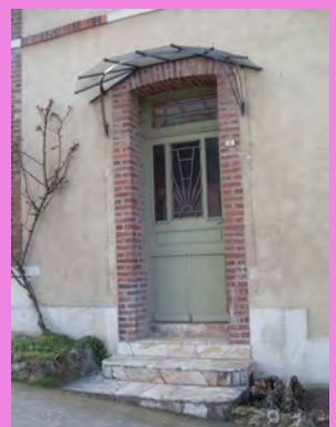
Marquise protégeant la porte d'entrée, peinte en vert pâle et ornée de ferronnerie sculptée