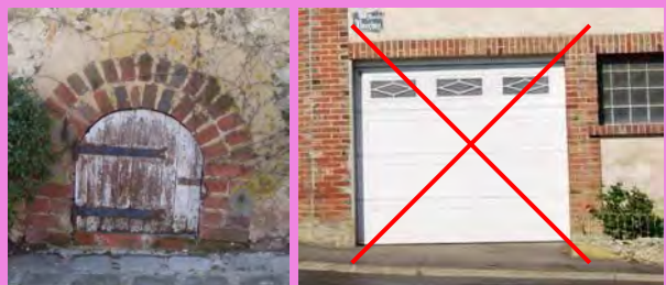
Un étroit percement cintré, protégé par un volet blanc épousant la courbure