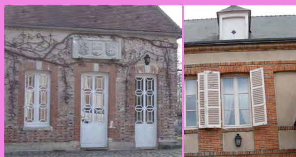
Menuiseries bois remarquables et singulières d'une construction, de Hautvillers, ornant l'ensemble des fenêtres et la porte peinte