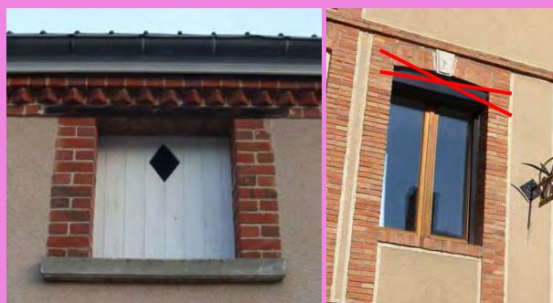
Une petite ouverture, fermée par une corniche ornée de briques, et remplie de lames verticales de bois peintes, percées d'un losange