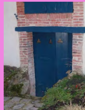
Menuiserie bois de couleur bleu saphir, de la porte de remise, percée d'un trèfle