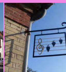
Enseigne colorée et légère avec son ombre portée, implantée en angle de bâtiment