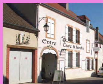
Multiplication des enseignes de 2 types sur une même façade pour un commerce