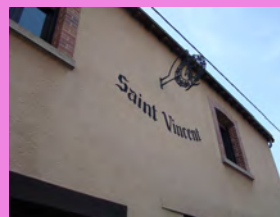
Enseigne peinte en noir associée à une enseigne en fer forgé, située sur une façade sobre

La pose d'enseignes à Hautvillers est soumise à autorisation du maire après avis simple ou conforme de l'Architecte des Bâtiments de France et du Parc Naturel Régional de la Montagne de Reims. Au sein du Parc, les pré-enseignes sont interdites dans les agglomérations : entrée, sortie et tissu urbanisé.