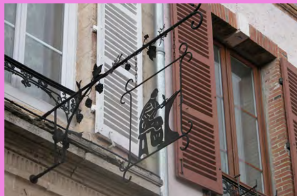
Enseigne en fer forgé de couleur noire, en accroche sur la corniche de pierre, dans l'axe de la porte d'entrée

La multiplication des enseignes en fer forgé au sein du cadre bâti dans les différents secteurs urbanisés de Hautvillers a un impact sur l'ambiance du village. Elle participe à l'identité urbaine et à l'animation du village.