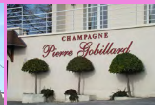
Enseigne en lettre détachée située sur un pan de mur plein