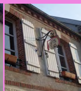
Enseigne suspendue, située en partie centrale du trumeau des fenêtres