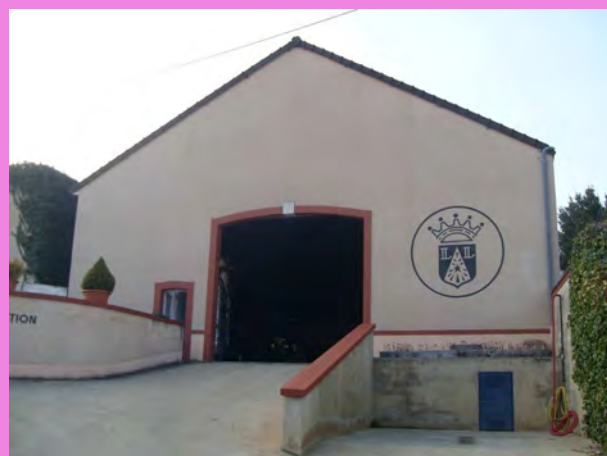
Logo dessiné par un graphiste, représentant l'emblème de la Maison de champagne, peint en noir sur un mur clair enduit