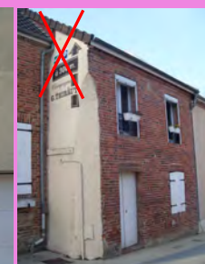
Pré-enseigne, située sur un mur pignon à éviter