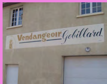
Enseigne peinte de grande longueur valorisée par trois teintes sobres