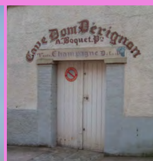
Enseigne peinte sur enduit sur le linteau et au-dessus de la porte de remise