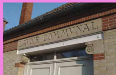
Lettre sculptée sur la pierre nommant la fonction d'origine de l'édifice, situé au-dessus du linteau de la porte,