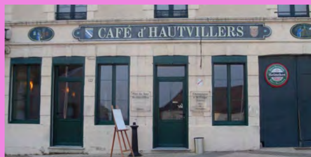
Enseigne de commerce peinte, positionnée le long du bandeau, en partie centrale de la façade du café de Hautvillers