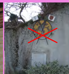
Enseigne en fer forgé, plaquée contre le mur