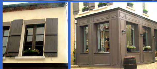
La construction récente au sein du tissu ancien s'intègre parfaitement avec la reprise de la morphologie typique, laissant une percée sur le bâti en fond de parcelle. Le rez-de-chaussée est traité de manière contemporaine comme un soubassement de teinte foncée avec de grandes ouvertures hautes, sans présence de murs fermés : Cette composition illustre le principe de retournement de la façade.