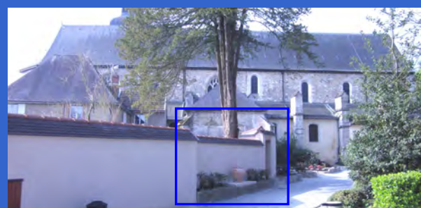
Cette extension, non perceptible depuis l'espace public, est implantée à l'arrière du mur de clôture minéral, en adossement contre une partie bâtie de l'un des édifices de l'abbaye.