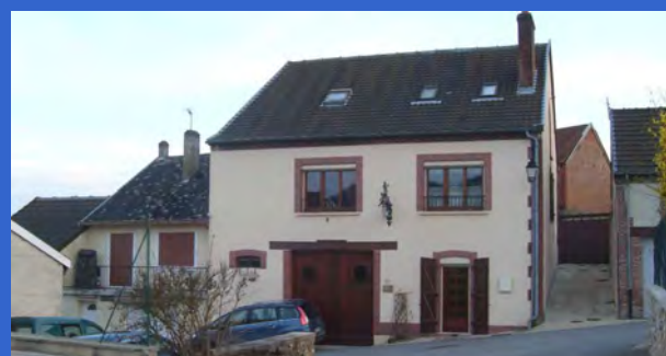
La maison actuelle et ses ouvertures plus longues que hautes ne présentent pas la même typologie de percements que le bâti du tissu ancien remarquable (Cf Fiche 14).