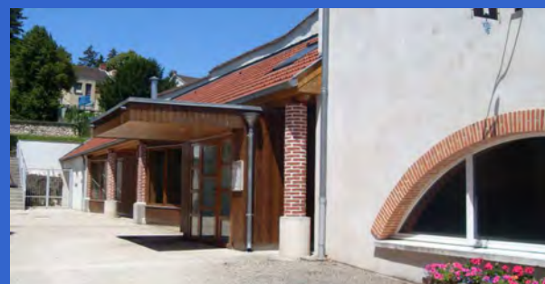
L'extension récente, peu visible depuis l'espace public, est située à l'arrière de la parcelle et adossée contre le mur de clôture mitoyen et la construction existante.